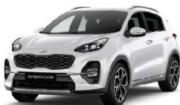
Kia Sportage per 2 viaggiatori + guida