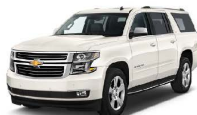
Chevrolet Suburban da 4 a 6 viaggiatori + guida