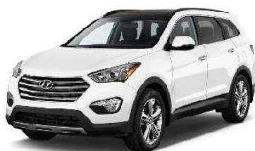
Hyundai Santa Fe per 3 viaggiatori + guida